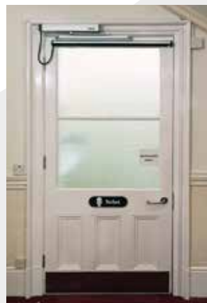
NEXT 150 + NEXT-BDT