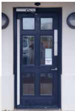
NEXT 75 + NEXT-BAS

Elettromagnete per chiusura porta Electromagnet for door lock