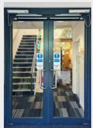
NEXT 75 + NEXT-BDT