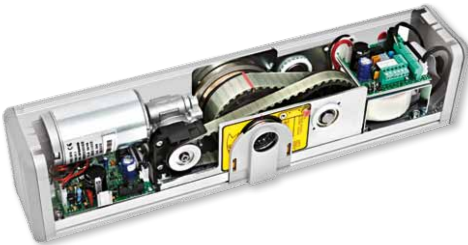
◀ NEPTIS LET/SLT.

NEPTIS is TÜV-gecertificeerd conform de nieuwe Europese Wetgeving EN16005 en heeft alle laboratoriumtesten ondergaan en behaalt die door de norm EN13849 voorzien worden met speciale verwijzing naar de analyse van de elektronische veiligheidscomponenten.