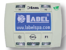
Programmatore digitale Digital selector