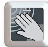
CLEARWAVE: sensore senza contatto CLEARWAVE: touchless sensor