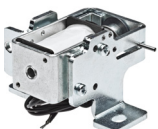
Elettroblocco Fail Secure / Fail Safe Fail Secure / Fail Safe electric lock